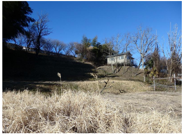
★売主の責任と負担で、抵当権抹消後引渡し。

保育園・中学校・ 病院・商業施設・ 阿智PAに近く、 利便性良好♪ 土地建物取得 助成金あり※条件有り