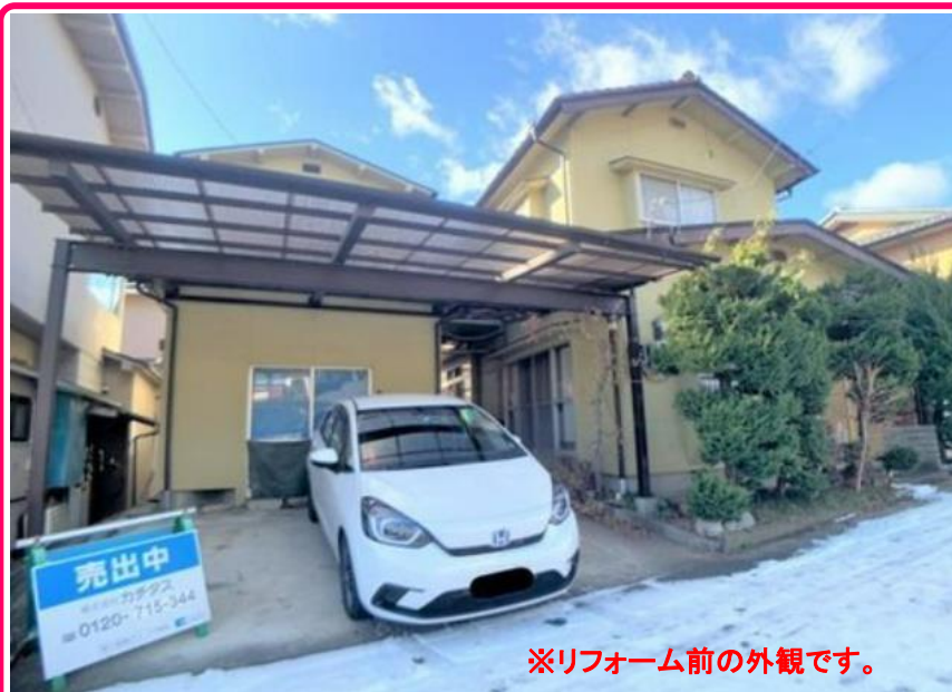
※リフォーム前の外観です。

キッチンはハウステック製の新品に交換します。鉄板は熱や傷にも強い人工大理石仕様なので毎日のお手入れが簡単です。