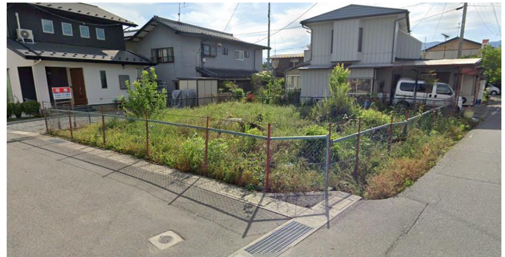
※現況と異なる場合があります